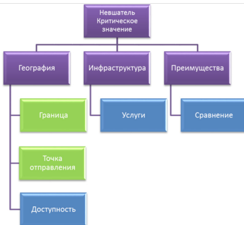
Рис. 3. Критический аспект

Поле атмосфера / праздник позволяет проследить важность коннотаций праздника для увеличения туристической притягательности города: Кафе, бары, уличные стойки и музыкальные группы оживляют старый город и делают жизнь веселее и праздничнее; Неповторимая праздничная атмосфера; Обжорство в неописуемых масштабах, веселье и упоение! (Невшатель). Понятие «праздник» вызывает у носителей русского языка такие ассоциации, как 'развлечение', 'настроение', 'застолье', 'безделье', 'радостное чувство', 'источник радости' [20].